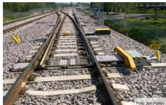
Fig.2 schimbător simplu de cale (macaz, sine de legătură, inimă simplă, sine de rulare cu contrast, dispozitiv de acționare)