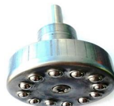
Fig.1.1 Cap de netezit