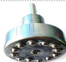
Fig.1.1 Cap de netezit